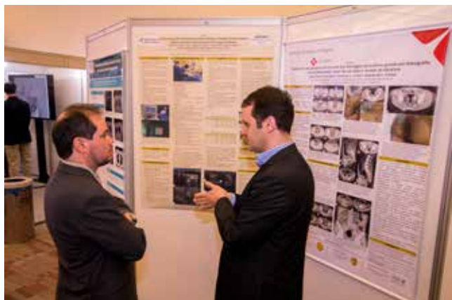
Recorde de trabalhos científicos inscritos no Congresso deste ano

Este ano, foi quebrado o recorde de trabalhos científicos aceitos para participar do congresso. Foram 187 no total, com os dez de maior destaque selecionados para apresentação oral em sessões específicas.