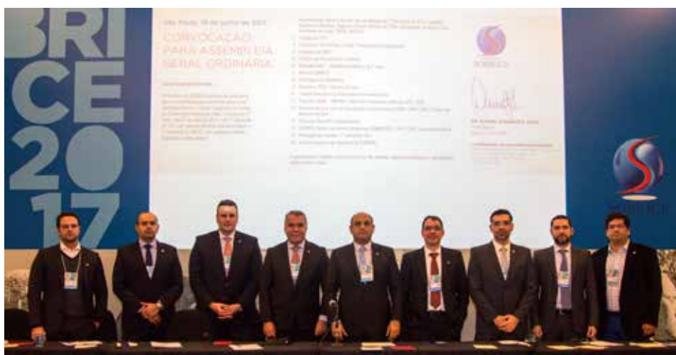
Diretoria 2017-2018 da Sobrice durante a Assembleia Geral

Foi realizado com grande sucesso, de 6 a 8 de julho, o XX Congresso da Sociedade Brasileira de Radiologia Intervencionista e Cirurgia Endovascular (Sobrice). O evento aconteceu no Centro de Convenções Rebouças, em São Paulo (SP), e contou com a presença de mais de 550 congressistas e a participação de palestrantes de renome nacional e internacional.