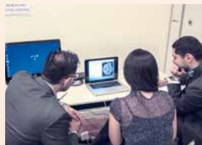
Prova de Título foi realizada durante o evento