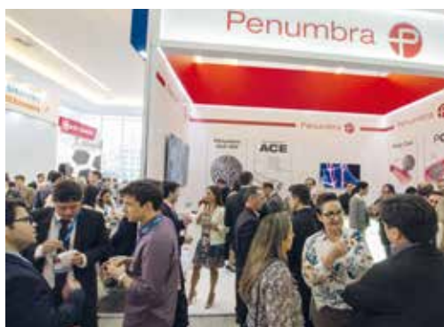
Público prestigiou a exposição comercial