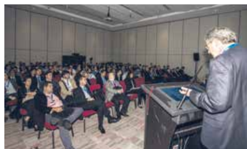
Sessões plenárias abordaram temas de ponta