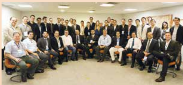
Prova de Título realizada durante o evento